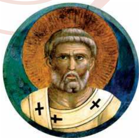
Św. Paweł według Giotta.

ALANYA – TARS – ANTIOCHIA – KAPADOCJA – KONYA – ANKARA – ISTAMBUŁ – TROJA – PERGAMON – EFEZ – PAMMUKALE – HIERAPOLIS – MYRA – ALANYA